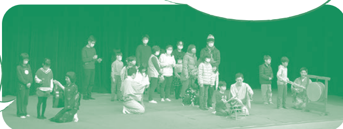
お囃子体験のようす

お囃子体験をはじめ、落語を子どもと楽しむという企画自体が面白く新鮮。一緒に参加した孫も喜んでました。(一般)