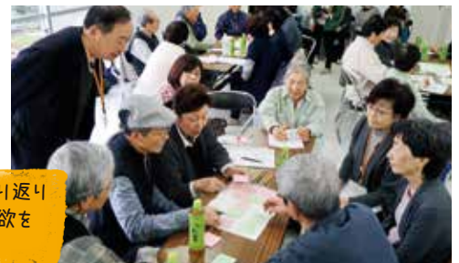
訓練の振り返りが活動意欲を高める

住民自身が進みたい活動が「人の輪」を広げ、また次の活動の「きっかけ」となる。この積み重ねが「安心して暮らせるまちづくり」の基盤になっている。