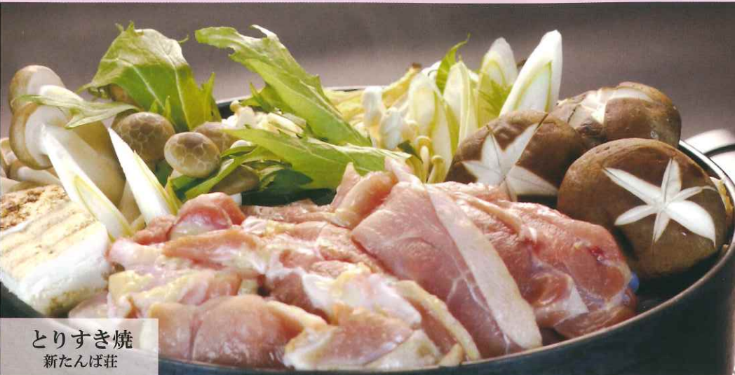
とりすき焼 新たんば荘

ひょうご憩の宿は兵庫県内に4ヶ所の施設があり、豊かな自然に恵まれた環境の中で、ご宿泊・会議研修・ゼミ・スポーツ合宿・サークル活動・レクリエーションなど若者からシニアまで目的に合わせてご利用いただけます。皆様のお越しをスタッフ一同心からお待ち申し上げます。