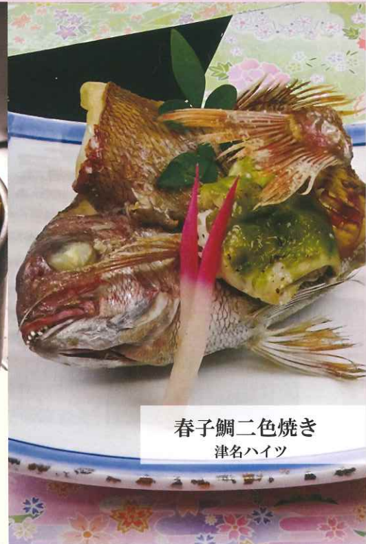
春子鯛二色焼き 津名ハイツ