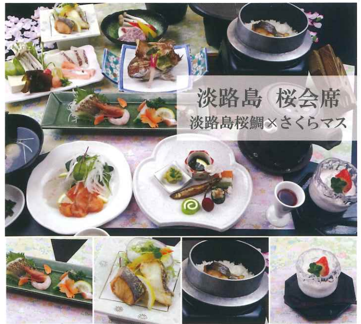
淡路島 桜会席 淡路島桜鯛×さくらマス