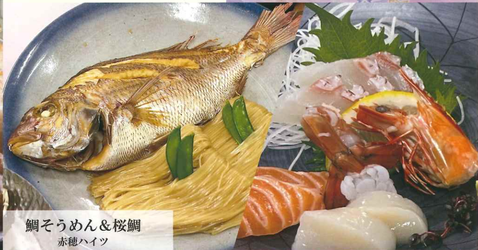
鯛そうめん&桜鯛 赤穂ハイツ