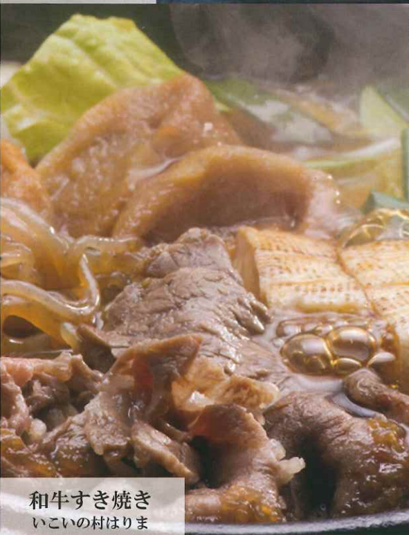
和牛すき焼き いこいの村はりま