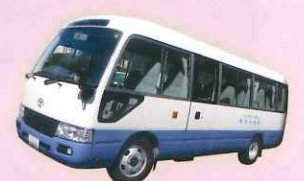
いこいの村はりま

※人数や場所等によってはマイクロバスでの送迎も可能です。各施設にご相談ください。