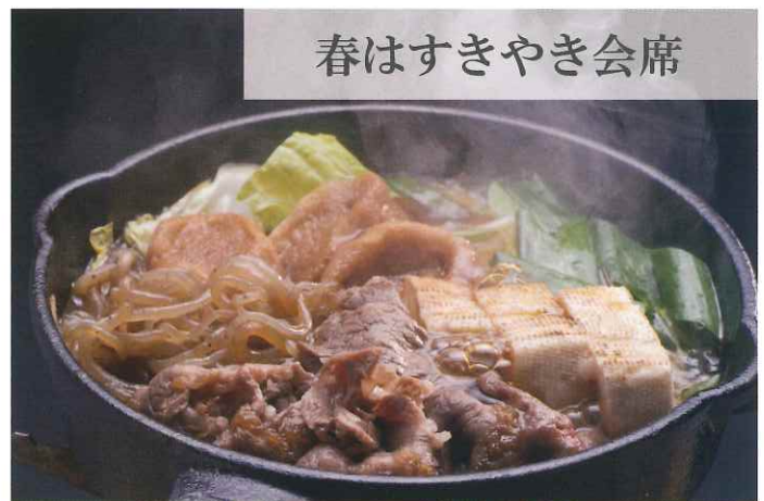
春はすきやき会席