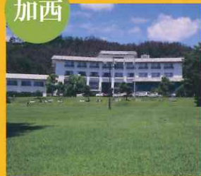
いこいの村はりま