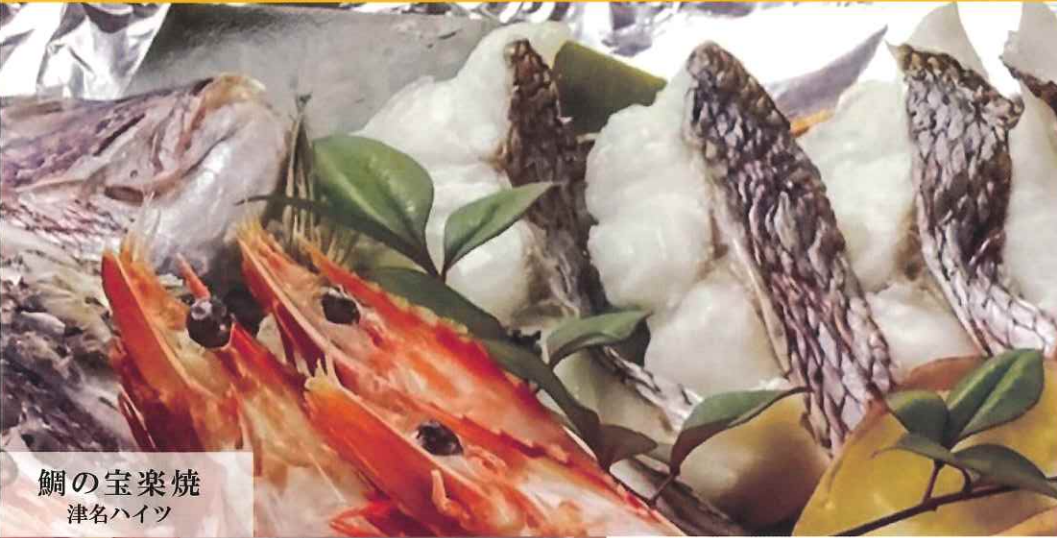
鯛の宝楽焼 津名ハイツ

ひょうご憩の宿は兵庫県内に4ヶ所の施設があり、豊かな自然に恵まれた環境の中で、ご宿泊・会議研修・ゼミ・スポーツ合宿・サークル活動・レクリエーションなど若者からシニアまで目的に合わせてご利用いただけます。皆様のお越しをスタッフ一同心からお待ち申し上げております。