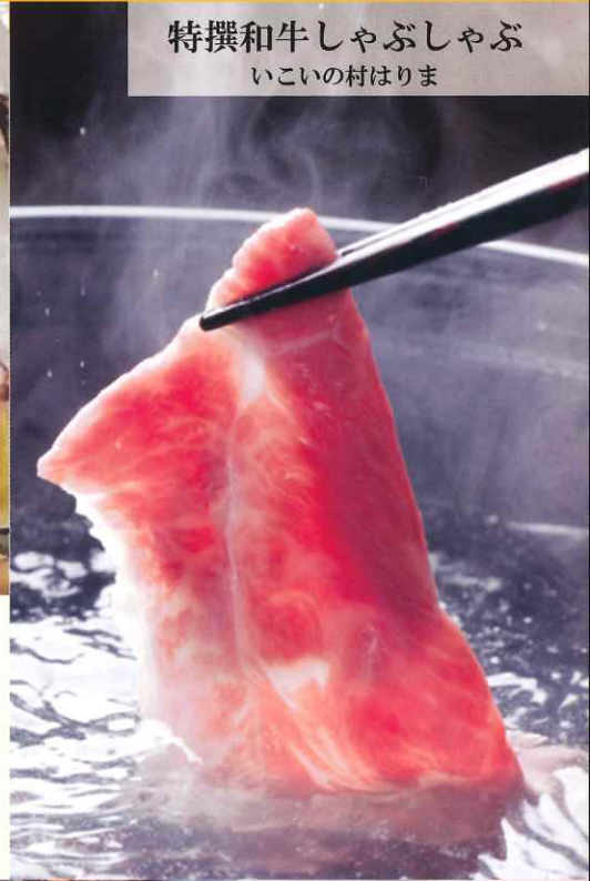
特撰和牛しゃぶしゃぶ いこいの村はりま