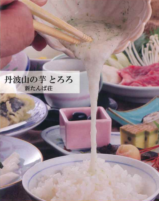
丹波山の芋とろろ 新たんば荘