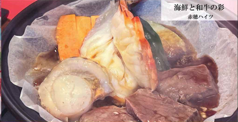
海鮮と和牛の彩 赤穂ハイツ