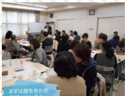
まずは顔を合わせ課題を出し合う

芦屋市には、住民と専門職が協働して地域課題を話し合い、その解決に向けて一緒に考えることを目的とした「地域発信型ネットワーク」が生