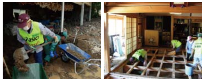
ひょうごボランティアプラザ「災害ボランティア隊」の活動