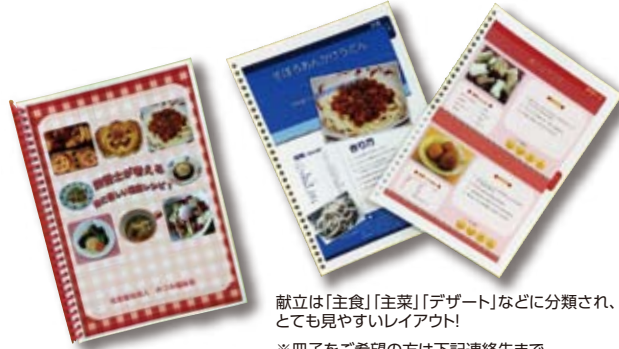
献立は「主食」「主菜」「デザート」などに分類され、とても見やすいレイアウト ※冊子をご希望の方は下記連絡先まで

本法人に従事している栄養士13名が一丸となり取り組んできた「レシピ本」が、このたび完成しました。入所施設の栄養士の場合、365日3食の食事の献立を考えています。この考え抜いた献立の数は莫大です。「入所ご利用者のためだけにとどめておくのではなく、この成果物を持ち寄り、よりすぐって、地域にお住まいの方にも紹介すればどうだろう」と考え、レシピ本として発行することにしました。料理を種別ごとに掲載したり、調理に使用している野菜の効能などを記載したりして専門的な角度から紹介しています。地域の方々にも興味をもっていただける仕上がりになっていると思います。それぞれの事業所で食事形態も違い、求められるサービスも異なります。さらに、個々のニーズに合った食事提供も求められています。これらは時代の流れであり、法人として当然対応していくべきことだと考えています。