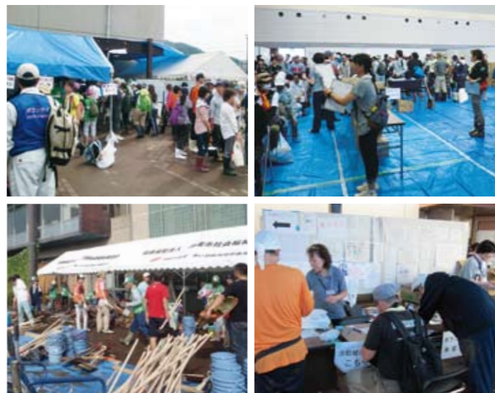
丹波市災害ボランティアセンターの様子