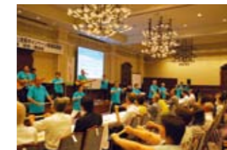
老人クラブの皆さんも一緒にご参加いただいた「やぶからぼうたいそう」

師として活躍し、ベストセラー「佐賀のがばいばあちゃん」などでテレビでもおなじみの島田洋七さんに登壇いただきました。幼少時に預けられた祖母に教わった生活の知恵や、「眠る」「笑う」「歩く」ことを通じた健康の大切さが楽しく語られ、会場は終始笑いの渦に包まれました。ご参加いただいた皆さま、ありがとうございました!