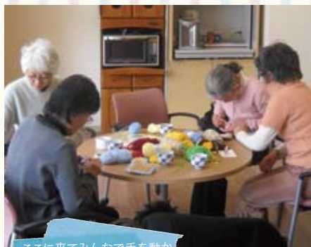
ここに来てみんなで手を動かすことが楽しみのなっています(ニットカフェの様子)

ボランティアセンターの担当をしていた頃に、高齢者生活支援センター(地域包括支援センター)から、「アクリルたわし」作りが生きがいになり、とても前向きになった高齢者がいる。地域で「アクリルたわし」を広められないかという相談がありました。すぐに社協から、高齢者生活支援センターやケアマネジャーなどに呼び掛け、ボランティア活動「たわしの輪」を広げていくための話し合いを