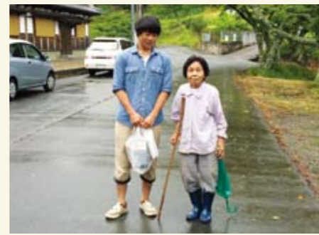
買い物の後は家まで荷物をお届けします！

「とらいあんぐる号」は、近隣の障害者施設から週末にワゴン車を安価で借り受け、2週間に1回、町内で希望があった富満、市原、黒石、小野の各自治会を1日かけて巡回する。当初から自治会の方の信頼を得るため、商品は町の中で仕入れた値段とした。始めたころは自治会で販売日を決めてもらい訪問していたが、そうすると「必ず買物をしなければ」との負担を生み出しかねないことから、販売日を決めてお知らせ