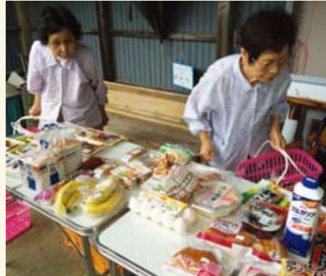
「とらいあんぐる号」での買い物の様子

ここは、学生が運営する移動スーパー「とらいあんぐる号」の訪問先の上郡町富満自治会だ。標高約300mにあり高齢・過疎化が進み、大半の住民は自動車の運転ができないので、自力で町の中心部まで買い物に出掛けることが困難な状況