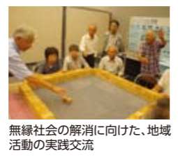
無縁社会の解消に向けた、地域活動の実践交流

篠山市では、9月1日に社協Dayとして、「いのちを守る地域づくり『お互いさまの支援活動に向けて』」をテーマに実践発表と講演を実施。地域における支え合いの活動について考える機会となりました。また、福祉委員によるコミュニケーション麻雀の体験サロンや、ボランティアによる大型紙芝居の披露など、日頃の活動がPRされ市民への活動の理解と交流が深まりました。