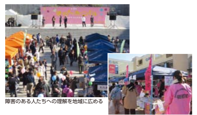
障害のある人たちへの理解を地域に広める

キャンペーンの協賛事業として、11月30日に第6回はっぴ〜カーニバル(主催:KOBEST NET西区自立支援協議会)が開催されました。地域交流を目的に、障害のある人が福祉事業所等でつくった製品の販売や、「東北応援市」、和太鼓等のステージ、障害疑似体験のスタンプラリー等、魅力いっぱいの内容でした。子どもから大人までたくさんの方にお越しいただき、会場いっぱいに笑顔があふれる一日になりました。