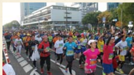
11月17日に実施された第3回「神戸マラソン」では、コース沿道の交通整理・給水ボランティアとして、各地のボランティアグループから80余名が参加しました。