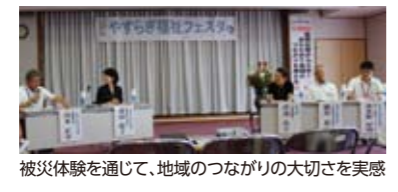
被災体験を通じて、地域のつながりの大切さを実感

宍粟市では、8月25日に社協が本部を置いている一宮保健福祉センターやすらぎのイベントとして、ボランティア連絡協議会や作業所等と連携し、「やすらぎ福祉フェスタ」を開催。当日は、4年前に市内を襲った豪雨災害について、被災住民や自治会の立場から語っていただき、平常時からの住民同士のつながりを大切にしたい取り組みが災害時にも生かされることが共有されました。