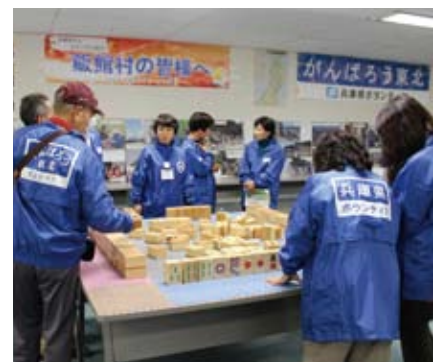
多くの団体等の協力により取り組まれたボランティア活動

プラザでは、発災から現在まで、ボランティアバスにより123回、延べ約5000人の県民ボランティアを継続して被災地に派遣し、復旧・復興に取り組んできた。