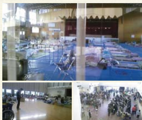
東日本大震災を契機にあらためて注目される「福祉避難所」

り。オムツなど高齢者介護に必要な日用品も備蓄されている。さらに、昨今の電力不足を契機に自家発電機を整備しているところも少なくない。社会福祉施設を持つこれらの機能を地域の社会的資源として積極的に提供していくことが、社会福祉法人の地域貢献の点からも期待されている。