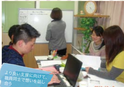
より良い支援に向けて、職員同士で想いを話し合う

子どもが周りの人と比べて違うことに対しての不安を話されました。その時、本人が「周り」と違って何が悪い」とと机を叩き叫びました。私は「人には得意、不得意があってもみんな違っていてそれで良いと思う。でも一緒にいたい人やいたと思う場所があるなら、そのことを知り、ルールを守っていくことも大切だ」と伝えました。すると、当事者の表情が変わり、その日から、積極的に人の話を聞いて、就労に向けて動き始めました。周りの人も「彼は会うたびに成長している」と驚かれるほどになったのです。本人も何か変わるきっかけを探していたのではないかと感じました。