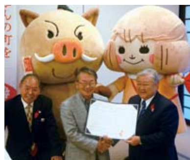
県内第1号として、(株)こんだぬくもりの郷(篠山市)と覚書の調印が行われました!

このプロジェクトは、企業等が実施する寄付つき商品・企画を「募金百貨店」になるというプロジェクトです。寄付金は、各市区町共同募金委員会を通じて、地域福祉課題解決の財源となります。企業にとっても社会貢献と販促につながる同プロジェクトにぜひご参加ください。