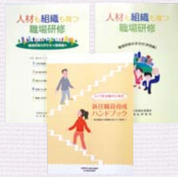
職場研修の各種手引書 (研修所のホームページからダウンロード可能)

の手引き(基礎編 実践編)や、新任職員のOJTの進め方や評価のポイント等を解説した『OJT担当者のための新任職員育成ハンドブック』などの手引書を発行している。その他、電話による職場内研修の講師紹介等の相談についても随時対応している。