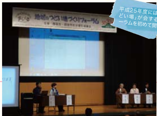
平成25年度には、「つどい場」が会するフォーラムを初めて開催

参加者がずっと待ち、「私とそうだったのよ」と声をかけると、その方の表情がすっと和らぐことができました。その人の折れた心に手を差し伸べたのは、サービスや制度ではなく、まさに同じ経験をした仲間なのだと思ってきました。そして後に、介護する家族を支える場の必要性から立ち上がったNPO法人「つどい場さくらちゃん」の開設にも関わりました。そこには、色んな人が混じり合い、しゃべり合い、支援する側もされる側もなく人と人がつながる「まじくる」の関係があります。この「つどい場」が、自宅や空き家を利用するなどさまざまな形で市内に広がっています。