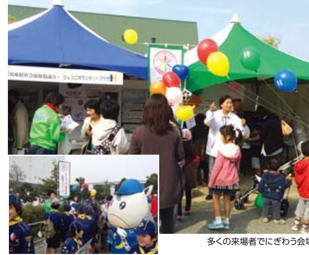
多くの来場者でにぎわう会場

全県キャンペーン推進協議会では、ひょうごボランティアプラザと共同して、「ストップ・ザ・無縁社会」全県キャンペーンの広報と、東日本大震災の被災地支援活動の報告を目的に、11月2日、3日の2日間、尼崎市の尼崎スポーツの森で開催された「ふれあいの祭典 阪神南ふれあいフェスティバル」に専用ブースの出展を行いました。