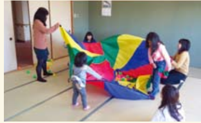
避難している子どもたちの笑顔をつくる

被災者生活支援活動「あんだんでは、自分達の持っている本や洋服などを売り、その代金を東北に届けよう」として始まった。現在では、東北の人々が作ったミサンガやストラップなどの手芸品を販売している。避難家庭支援活動「サンデーロボット」は、兵庫県に避難している