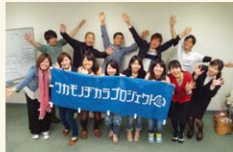
自らの思いを形にする「ワカモノ」たち

母子世帯の方々など対象に、子どもたちと学生が一緒に遊ぶという活動だ。このほかも、東北で自分たちが見たものを発信する活動「ツタリベ」や、学生による支援団体のネットワーク化を目指して開催する「学生未来フォーラム」など、それぞれの活動に学生スタッフが責任を持って取り組んでいる。