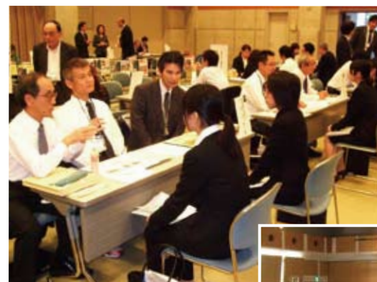
求職者と事業者の懸け橋に

参加した求職者の内訳は、おおむね学生が4割、それ以外が6割であり、一般求職者の姿が多くみられた。中でも、福