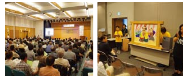
篠山市協会の「社協Day」(9月1日)の様子

このほかにも、キャンペーンの趣旨に合致する事業がありましたら、本ページで広報いたしますので、ぜひお知らせください！