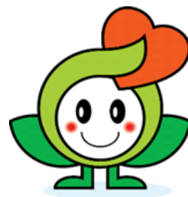
互助会マスコット ハーミン