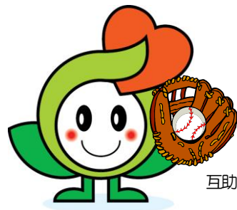
互助会マスコット ハーミン