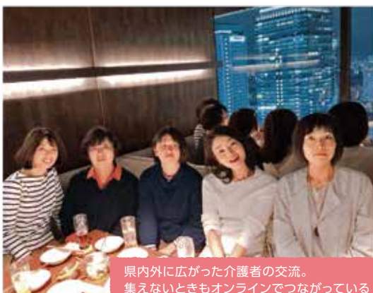
県内外に広がった介護者の交流。集えないときもオンラインでつながっている