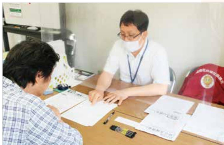
感染防止対策を図りながら、来所者に寄り添って相談対応する社協職員

本特集では、生活に困窮した人々のニーズにいち早く応え、生活福祉資金を活用して相談支援を行った社協職員の奮闘をレポートするとともに、貸付から見てきた地域での取り組み課題を探り、社協活動の今後を考えてみたい。