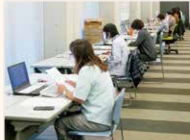
膨大な申請に対応する 県社協の特設事務センター