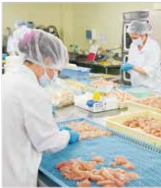
加工作業の様子。地元の資源から、新しいものを生み出します

品質への自負がありましたので、自社のブランドを高めようと、プレゼン資料を片手に百貨店を回りました。商品コンセプトを明確化し、作業効率を高めた成果もあり、大手百貨店で販売いただけるようになりました。百貨店に「すみれ」の名が付いた製品が並ぶことは、作り手である利用者本人にとっても自信になり、働く意欲にもつながっています。