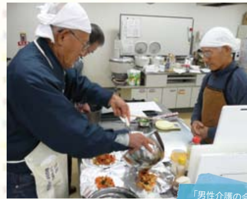
「男性介護の会」 男のクッキング

3年前に立ち上げ支援からかわった「男性介護者きたいの会」のこと。長年、重度の奥さんを介護されている男性が、「苦しみやつらさは