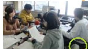
「ラジオ局の今後を住民と支援者が一緒に考える会」を開催した南相馬災害エフエム

東日本大震災により通信インフラや防災無線が破壊され、被災者への情報伝達手段が失われる中、必要な情報を届ける災害ラジオ局が次々に立ち上がり、震災から10か月以上が経過してもなお10数局が放送を続けています。そして、そのほとんどのラジオ局は放送の経験のない住民や行政職員が必死になって活動を続けているのです。