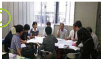
陸前高田市の地域包括支援センターと打ち合わせ

一方、日本社会福祉士会による連絡調整のもと、兵庫県からは4月1日より宮城県東松島市の地域包括支援センターへ社会福祉士の派遣を開始しました。その後、宮城県南三陸町、石巻市、岩手県大槌町、山田町、陸前高田市へ派遣先を拡大し、これまでに本会から延べ250名、