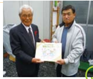
ボランティアの絵手紙付の福祉カレンダー

宮城県で被災地支援に携わった2名の派遣職員の報告を受け、発災から6か月を迎えた翌日の理事会で、仮設住宅入居者同士の会話のきっかけづくりや癒しの一助になればと「福祉カレンダー」を作製し、気仙沼市の被災者にお届けすることを決定しました。