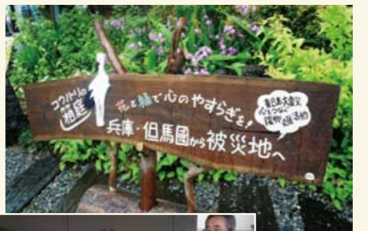
コウノトリのイラストは北井さんのデザイン