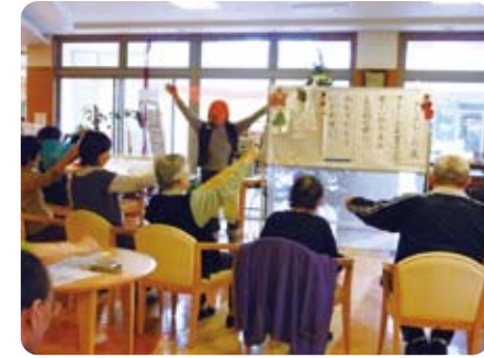
体も使ったミュージックセラピストの養成講座

愛ちゃん 愛ちゃん、今回は平成23年度NHK歳末たすけあい義援金を活用して取り組んだ「ハーモニー」の活動を紹介しますよ! ミュージックセラピスト は音楽の持つ力を活用して人とかわり、人の心と体の健康を維持・増進する支援をするんだよね? そうだね 。同会では、ボランティアを対象にミュージックセラピストの養成講座を実施したんだ。ミュージックセラピー体験や歌・動き・楽器のワークショップ、模擬セッション発表など3回に分けて実施されたよ。最後には修了式もしたんだ! なるほど 、地域ボランティアを養成することで、ボランティアの輪を広げているのね。修了者はスタッフとして活動できるのかしら? もちろんです 。会員になると活動スタッフとして社会福祉施設や地域福祉センターなどで活躍しているよ。会員は58名。主婦をはじめ、いろんな職業や資格を持った会員がたかさんいるんだ。活動範囲は明石市から尼崎市まで約20か所。昨年は、東日本大震災で被災された方たちのケアに、福島