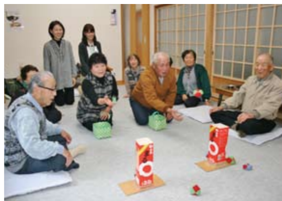
住民と社協がいっしょに進めていく「出前ふれあいサロン」

この計画のもう一つの大きな特徴は、限界集落化していく地域への支援だ。宍粟市でも近年、限界集落化していく地域が増えている。そこで、そこに住む人たちの思いである「住み慣れた地域でいつまでも自分らしく暮らし続けたい」という願いを実現するため、「出前ふれあいサロン」の実施や「暮らしの何でも相談所」の設置など、地域の拠点整備