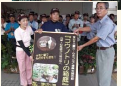
8月宮城県岩沼市災害ボランティアセンターへ寄贈

もとに、箱の制作や色塗り、イラスト、文字書き、植栽など呼びかけ団体の人々の手により準備が進められた。但馬の人々の思いが表現された「コウノトリの箱庭」は、昨年6月に宮城県東松島市へ兵庫県からのボランティアの手で、また、8月には岩沼市へと各10箱が届けられた。後日、岩沼市の仮設住宅の方から「自分で寄せ植えしたい」という要望が届き、10月に希望者24世帯に贈られた。そのお礼として、「コウノトリの箱庭」からの「生きる力」がありとうございます」などのメッセージや写真が届いた。さらに、日吉老人会、手芸部から手編みの品々が贈られた。